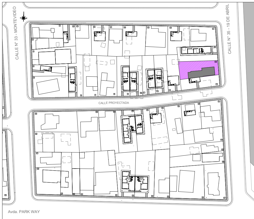
Plano de ubicación esc. 1.1000